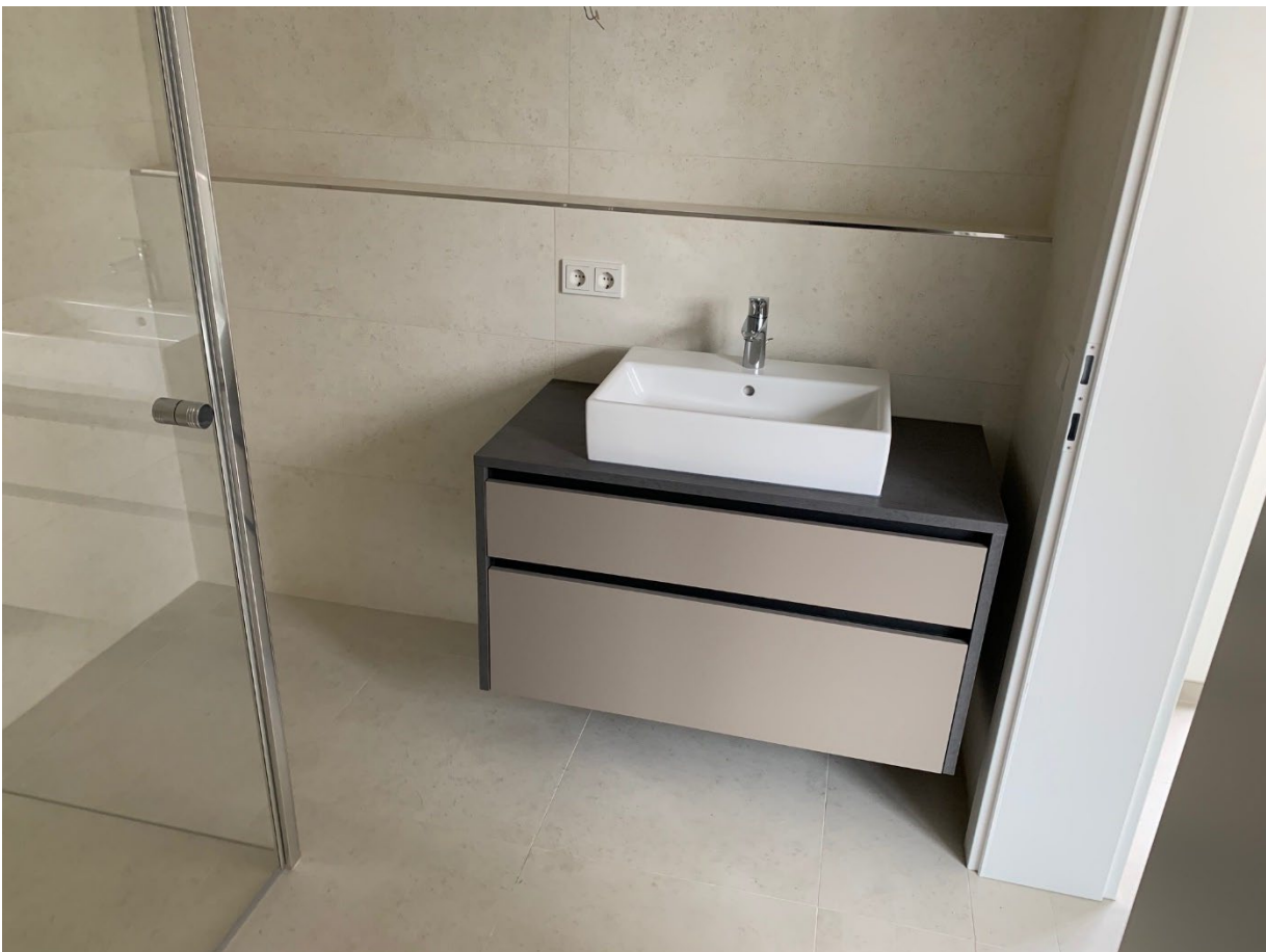
Badezimmer / Wc